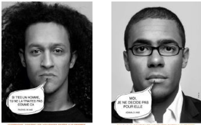
CAMPAGNE CONTRE LES VIOLENCES FAITES AUX FEMMES