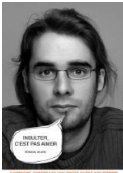
CAMPAGNE CONTRE LES VIOLENCES FAITES AUX FEMMES