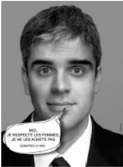
CAMPAGNE CONTRE LES VIOLENCES FAITES AUX FEMMES