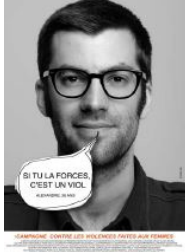
CAMPAGNE CONTRE LES VIOLENCES FAITES AUX FEMMES