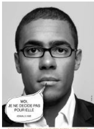
CAMPAGNE CONTRE LES VIOLENCES FAITES AUX FEMMES